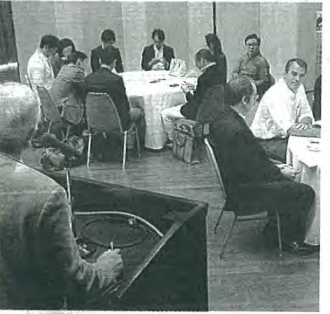
IT関係企業の経営者らが情報 交換したPBEC「テック・ト ーク」(29日午前10時半ごろ)

気象庁によると、29日午 前も火口からは噴煙が上が り、噴火は続いた。 (4、5面に関連記事)